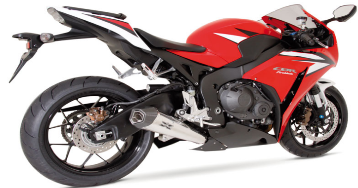
Honda CBR 1000 RR Modell 2012