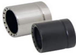
Ø 84 mm "Perforated"