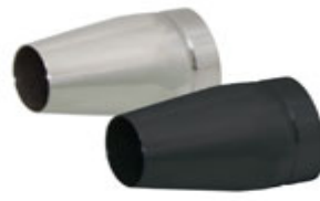
Ø 84 mm "Tapered"