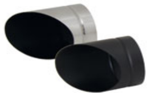
Ø 84 mm "Slash cut"