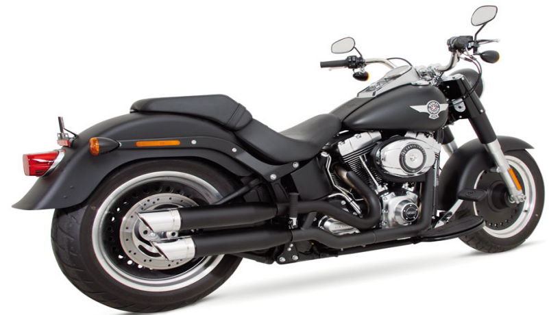
Harley Davidson Softail Fat Boy ab 2012