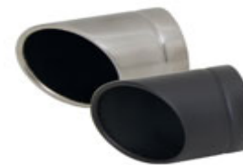
Ø 84 mm "Rolled up"