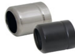
Ø 84 mm "Straight end"