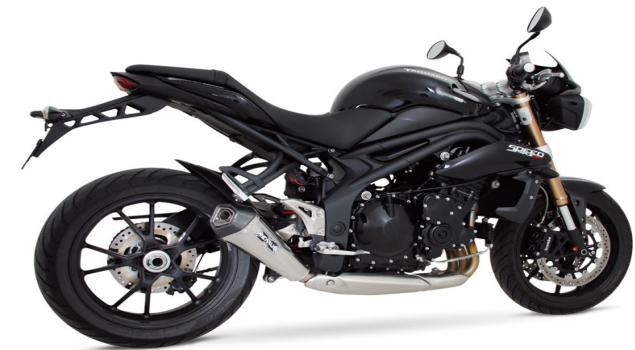
Triumph Speed Triple 1050 ab 2012