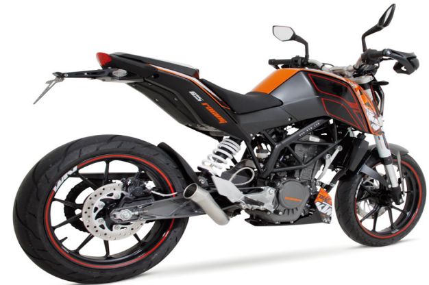
KTM 125 Duke Mod. 2011 - REMUS GP LOOK