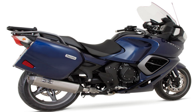
Triumph Trophy SE Mod. 2013