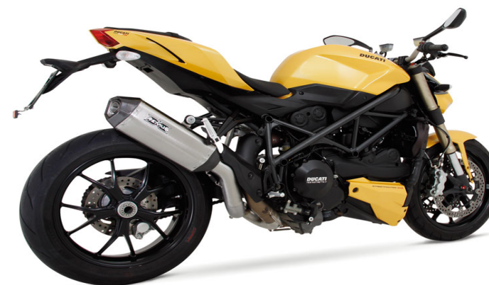
Ducati Streetfighter 848 Mod. 2013