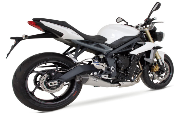
Triumph Street Triple 675/ 675 R ab 2013