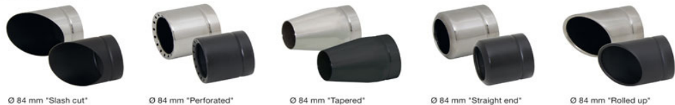
Ø 84 mm "Slash cut"