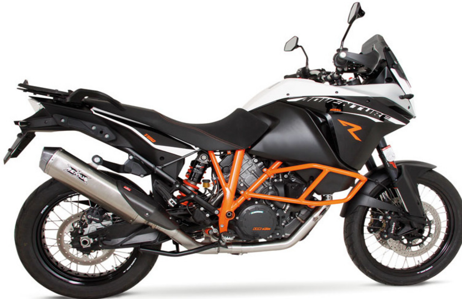
Photo complete system

Abbildung kann vom Original abweichen / Picture can deviate from original product