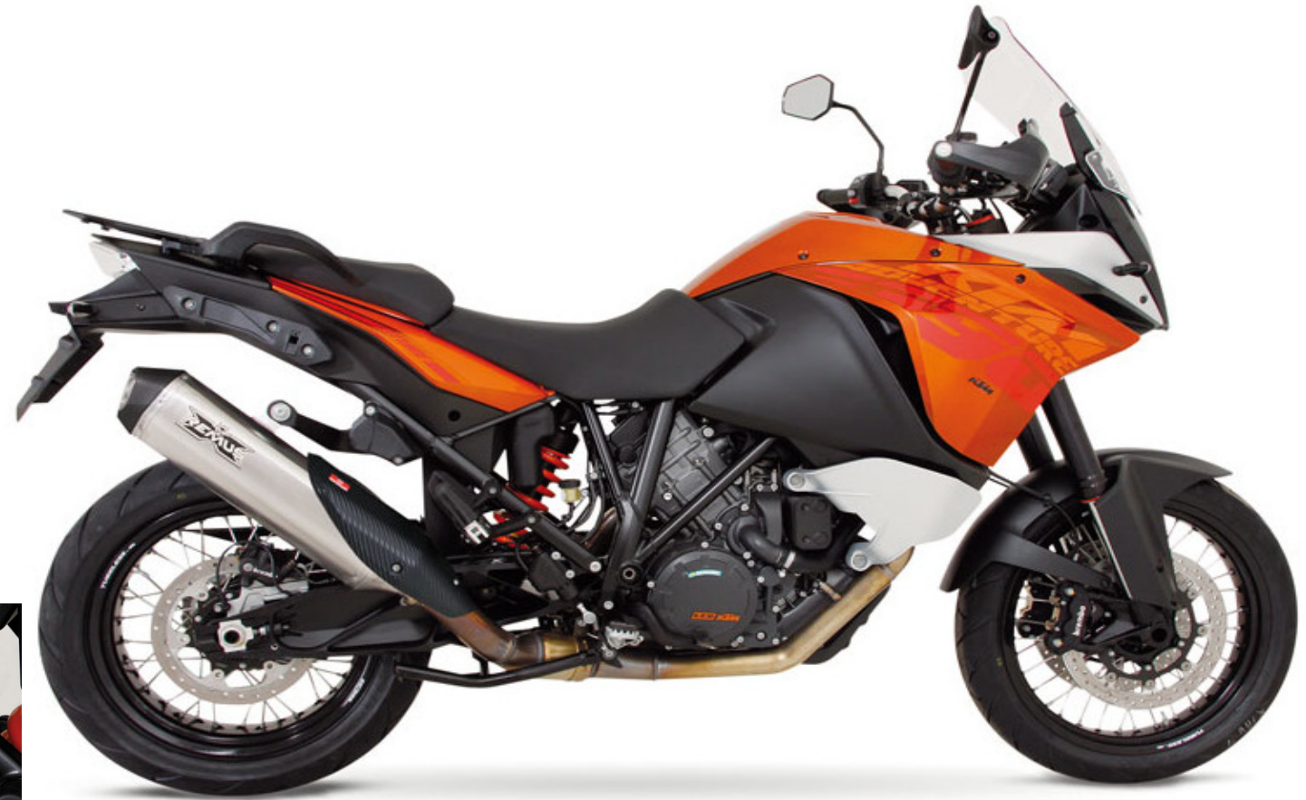
Photo slip on