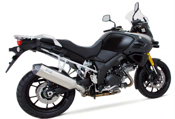
Suzuki DL 1000 V-Strom Mod. 2014