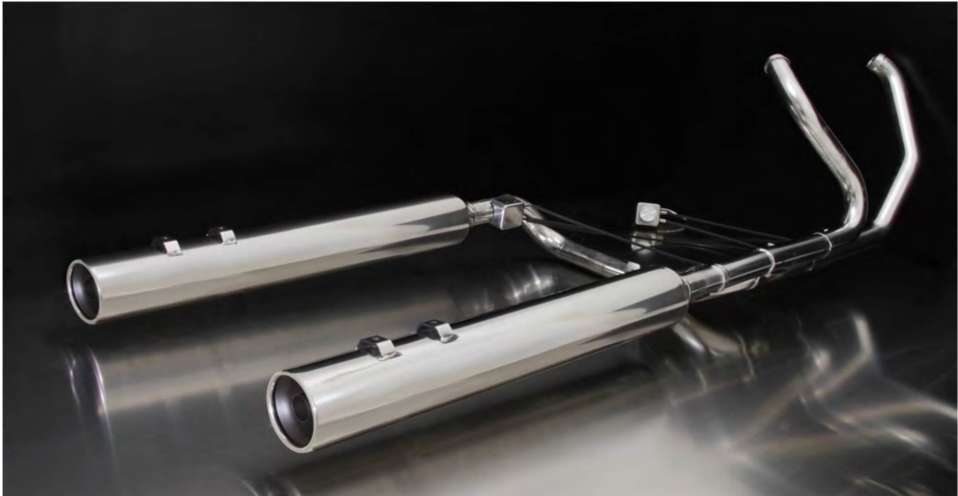
MCS complete system

Abbildung kann vom Original abweichen / Picture can deviate from original product