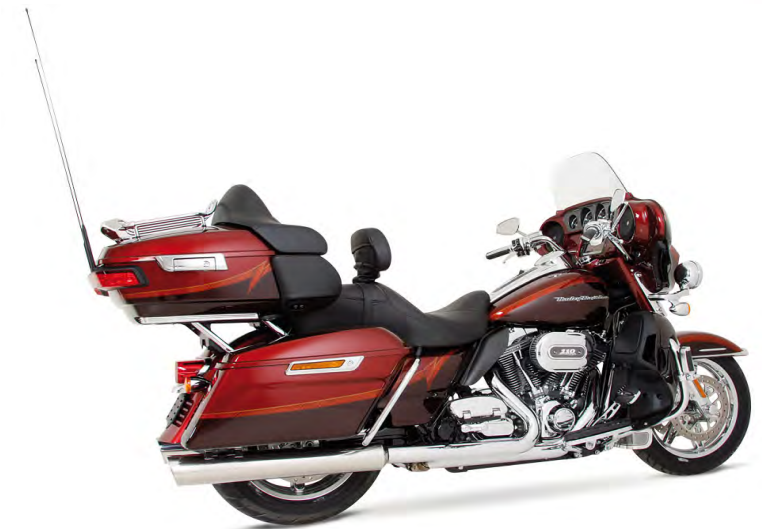
Harley Davidson CVO Ultra Limited Mod. 2014